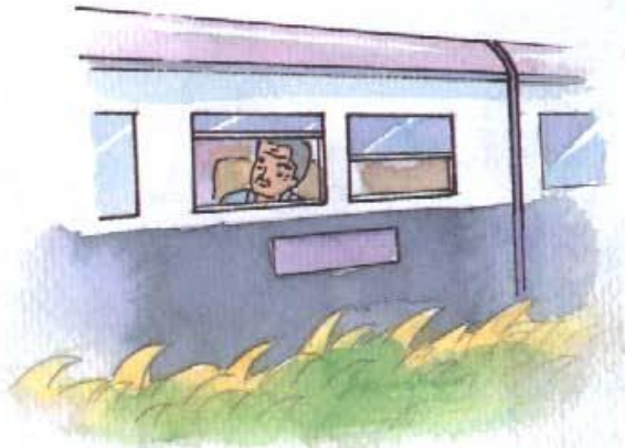
ตา มา รถไฟ