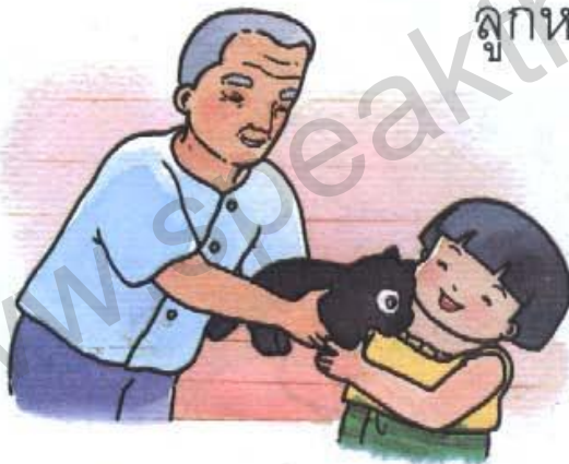
ตา มี ลูกหมา มา ให้ แก้ว