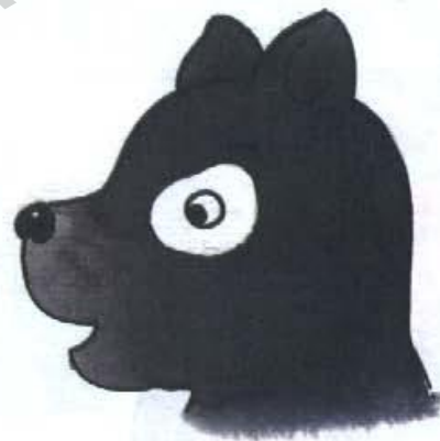
ลูกหมา ชื่อ ดำ