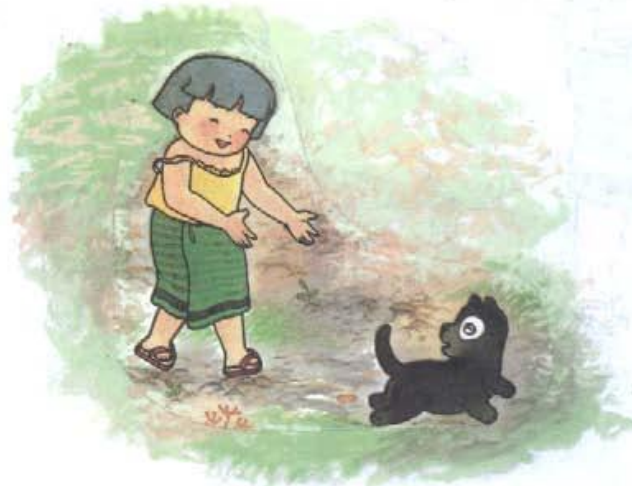
แก้ว เล่น กับ ดำ